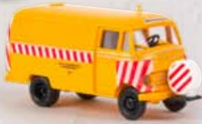
v 36031 MB L 319 Weichenreinigung/ Bogestra