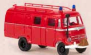
v 36609 MB LF 319 LF 8 rot/weiß