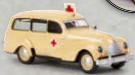
n 27353 EMW 340 Kombi „Krankenwagen“, TD