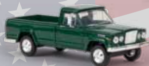
v 19803 Jeep Gladiator A (1962) moosgrün, TD