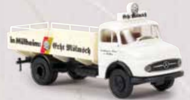
47030 MB L 322 „Mölsch Bier“