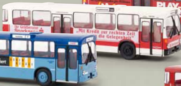
50717 MB 0 305 „Sparkasse“/VHH, TD