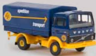
v 34754 Volvo F613 „ASG“