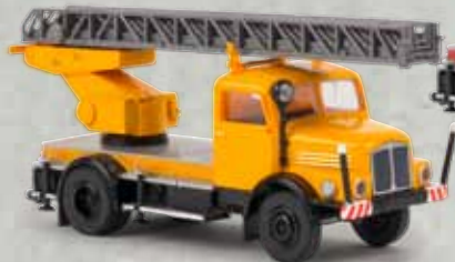
v 71728 IFA S 4000-1 DL 25 Kommunalfahrzeug, TD