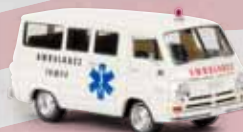
v 34323 Dodge A 100 Bus „Tampa Ambulance“, TD