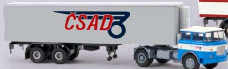
n 71804 LIAZ 706 Kühlkoffer-Sattelzug „CSAD“