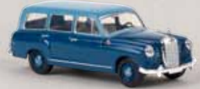
v 13465 MB 180 Kombi hellblau/dunkelblau