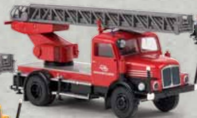
v 71729 IFA S 4000-1 DL 25 „Interflug“, TD