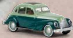
v 27315 EMW 340 blassgrün/blaugrün, TD