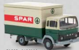
v 34803 DAF F900 „Spar“