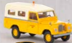
Starmada v 13779 Land Rover 109 „British Rail“