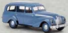
v 27354 EMW 340 Kombi taubenblau, TD