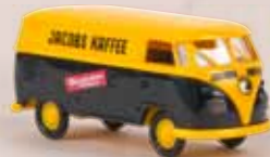
v 32687 VW Kasten T1b „Jacobs Kaffee“