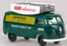
v 32691 VW Kasten T1b „Hankkija“