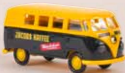
v 31579 VW Kombi T1b „Jacobs Kaffee“