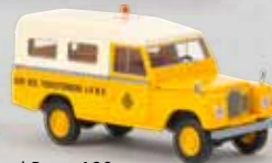
Starmada v 13780 Land Rover 109 „ANWB“