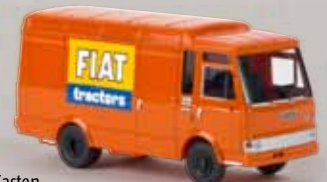
34527 Fiat Zeta Kasten „Fiat Tractor“