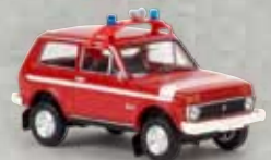
27217 Lada Niva „Feuerwehr“, TD