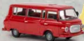
30037 Barkas B1000 Bus karminrot, TD