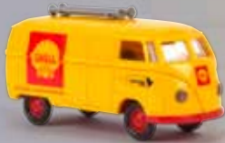
v 32051 VW Kasten T1a „Shell“/Flughafen Stuttgart