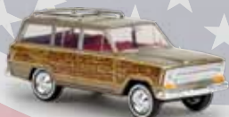
19856 Jeep Wagoneer „Woody“ gold-met., TD