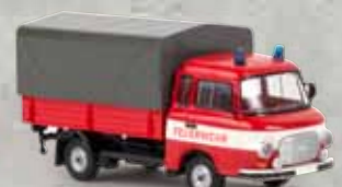
30309 Barkas B 1000 PP „Feuerwehr“, TD