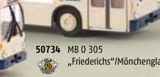
50734 MB 0 305 „Friederichs“/Mönchengladbach, TD