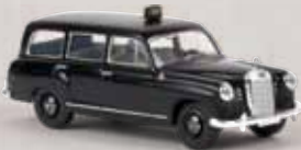
v 13463 MB 180 Kombi „Taxi“