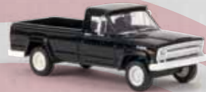
v 19807 Jeep Gladiator B (1967) schwarz, TD