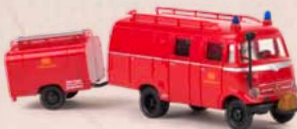
v 36608 MB LF 319 LF 8 TSA-Anhänger, Bahnfeuerwehr