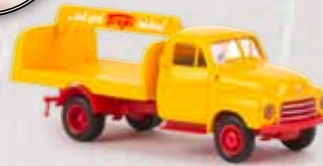
v 35330 Opel Blitz „Tropi“