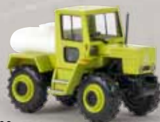
13709 MB trac 800 hellgrün/Wassertank