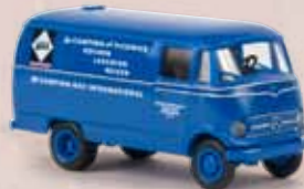
v 36025 MB L 319 „Camping Gaz“