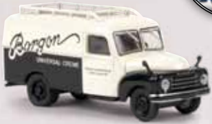
v 58161 Hanomag L 28 Kasten „Borgon“