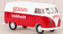
v 32688 VW Kasten T1b „Granini“