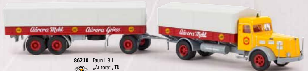
86210 Faun L 8 L „Aurora“, TD