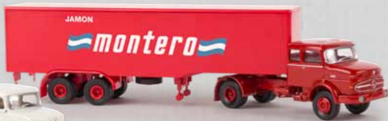
v 81113 MB LS 1620 „Jamon Montero“

Wegen der großen Nachfrage schon jetzt neue Farben beim Jeep Gladiator!