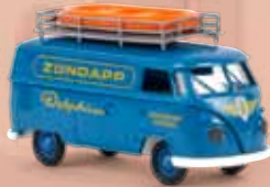
v 32683 VW Kasten T1b „Zündapp Delphin“