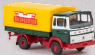
v 34755 Volvo F613 „Bilspektion“