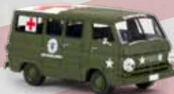
v 34322 Dodge A 100 Bus „US Army medical Service“, TD