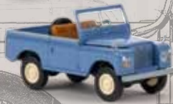
n 13851 Land Rover 88 taubenblau