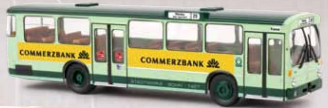
v 50769 MB O 305 „Commerzbank“/Bonn, TD