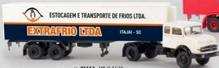
v 81112 MB LS 1620 „Extrafrio“