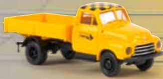
v 35332 Opel Blitz Flughafen Stuttgart