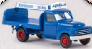
v 37127 Hanomag L 28 „Aquila“