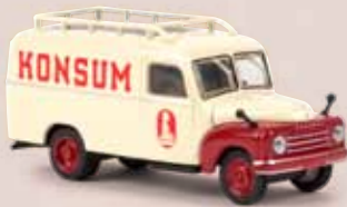
v 58163 Hanomag L 28 Kasten „Konsum“