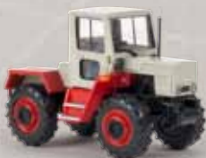
13700 MB trac 800 grau/rot