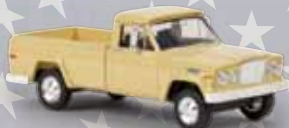
v 19802 Jeep Gladiator A (1962) elfenbein, TD

Wegen der großen Nachfrage schon jetzt neue Farben beim Jeep Gladiator!