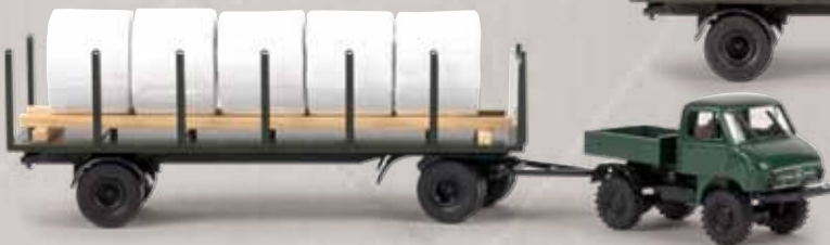
v 39114 Unimog 411 mit Anhänger und Heuballen 39156 Unimog 402 mit Anhänger und Schwartenbunde