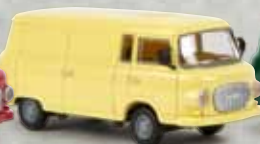
30112 Barkas B1000 Kasten pastellgelb, TD