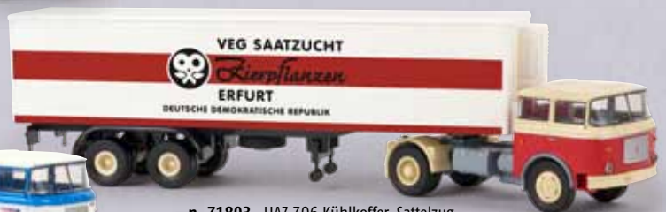
n 71803 LIAZ 706 Kühlkoffer-Sattelzug „VEG Saatzucht“