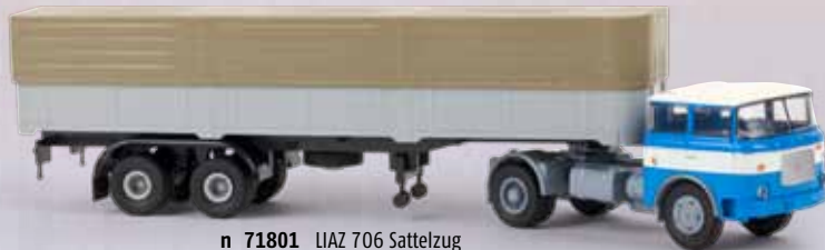
n 71801 LIAZ 706 Sattelzug blau/grau

Bereits 1957 stellte Skoda mit dem 706 RT einen modernen Frontlenker vor, der bis 1987 optisch nahezu unverändert gebaut wurde. Nachdem die DDR die Fertigung von Schwerlastwagen einstellen musste, wurden die schweren Skoda vom sozialistischen Bruder bezogen und beherrschten bald das Straßenbild.