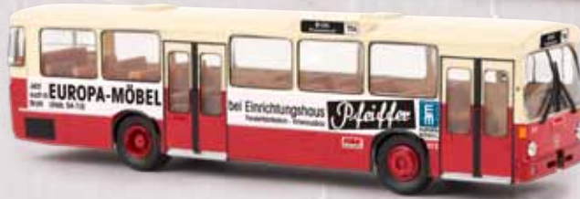
v 50767 MB O 305 „Europa Möbel“/KBE, TD