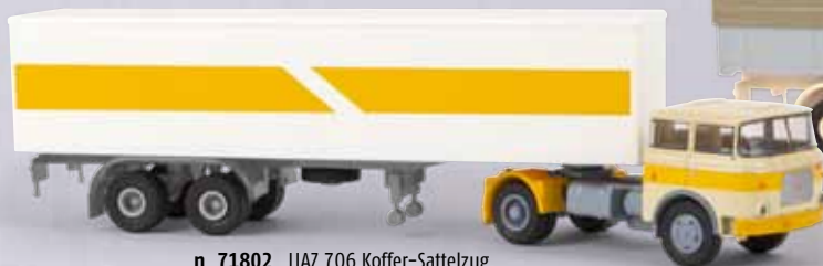
n 71802 LIAZ 706 Koffer-Sattelzug elfenbein/gelb