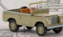
n 13852 Land Rover 88 gelbgrau