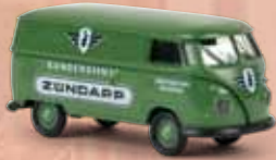
v 32682 VW Kasten T1b „Zündapp Kundendienst“