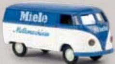
v 32050 VW Kasten T1a „Miele Melkmaschinen“