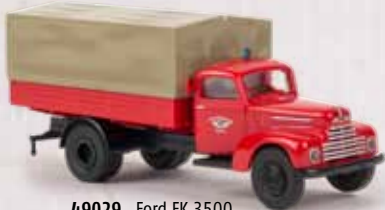
49029 Ford FK 3500 BF Köln