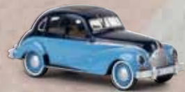
v 27316 EMW 340 stahlblau/pastellblau, TD