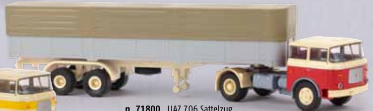
n 71800 LIAZ 706 Sattelzug rot/elfenbein