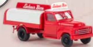
v 37128 Hanomag L 28 „Lindener Biere“