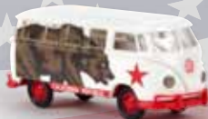
31838 VW Mindersamba T1b „California Republic“