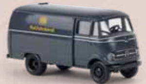
v 36030 MB L 319 „Rollfuhrdienst“ der DB