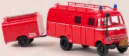
v 36607 MB LF 319 LF 8 TSA-Anhänger, rot/schwarz