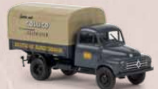
v 38027 Borgward B 1500 „Collico“ der DB