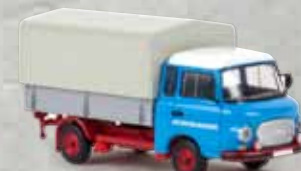
30306 Barkas B 1000 PP „LPG Roter Oktober“, TD