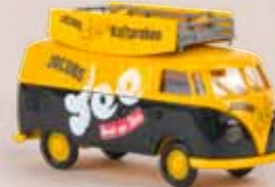
v 32692 VW Kasten T1b „Jacobs Tee“