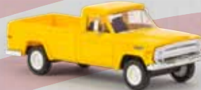
v 19805 Jeep Gladiator B (1967) gelb, TD