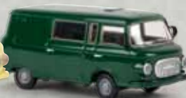
30220 Barkas B1000 Halbbus moosgrün, TD