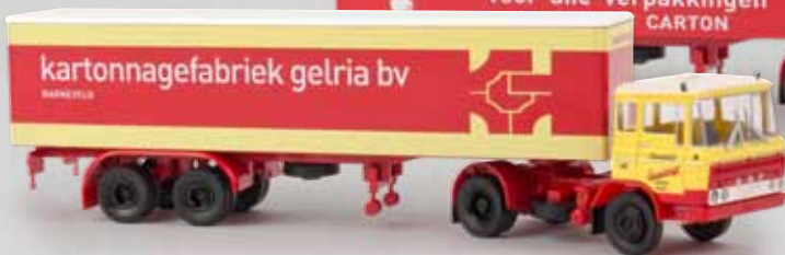
85265 DAF FT2600 „van Reenen“ 85266 DAF FT2600 „van Reenen/Gelria“, klassische Version“ 85267 DAF FT2600 „van Reenen/Gelria“, moderne Version“